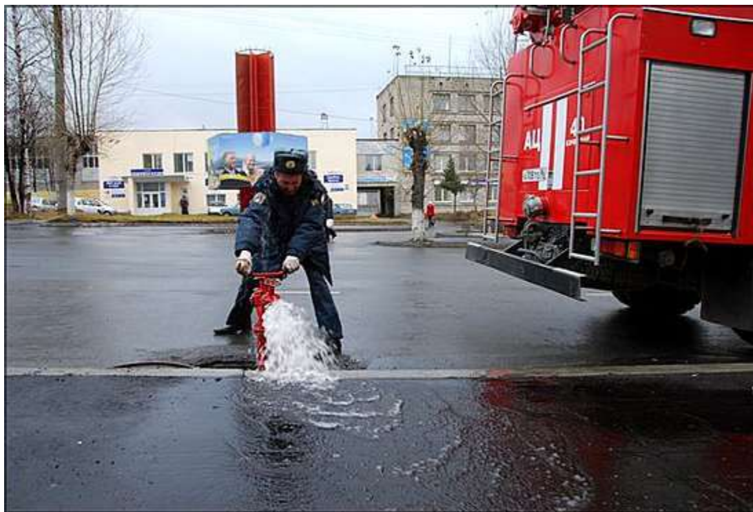
Пожарный гидрант: контроль МЧС