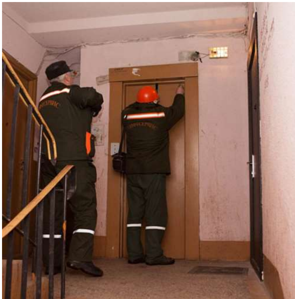
Лифт: обязательный сервис, контроль Ростехнадзора